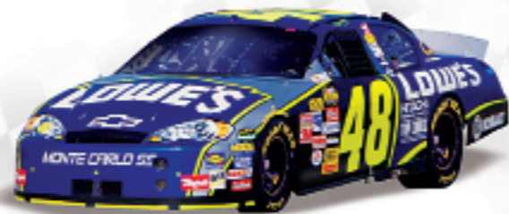
2006 Cup Champion Jimmie Johnson